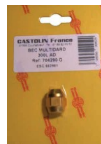
Bec Multidard Ref : 704290G