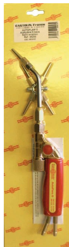
AutoFlam 0 Ref : 45200