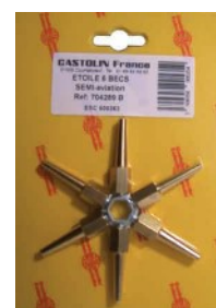
Etoile 6 becs Semi-Aviation Ref : 704289B